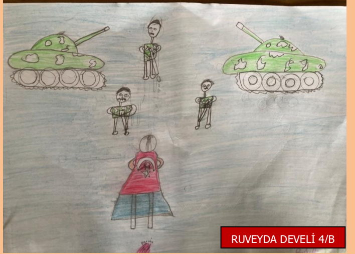
RUYEYDA DEVELİ 4/B