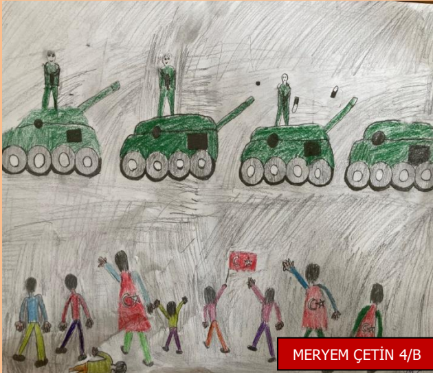
MERYEM ÇETİN 4/B