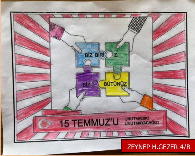
ZEYNEP H.GEZER 4/B