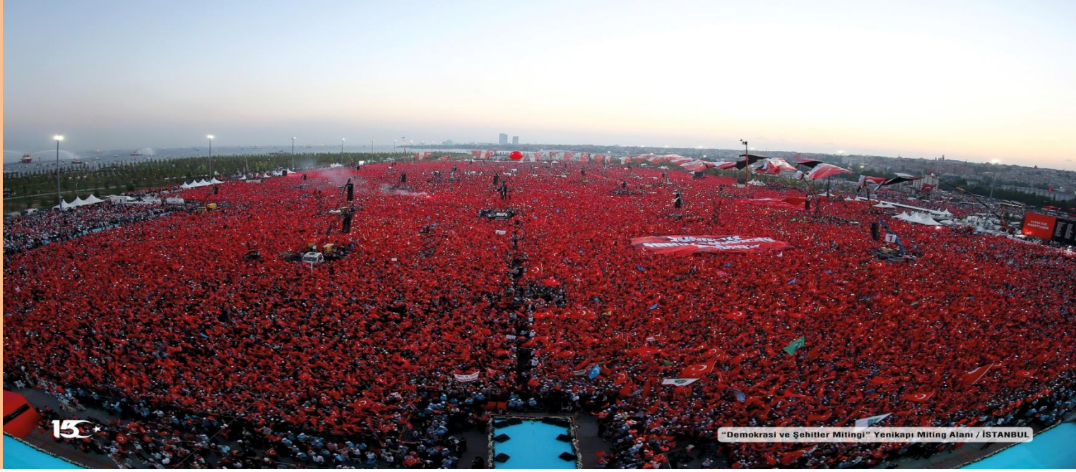
"Demokrasi ve Şehitler Mitingi" Yenikapı Miting Alanı / İSTANBUL