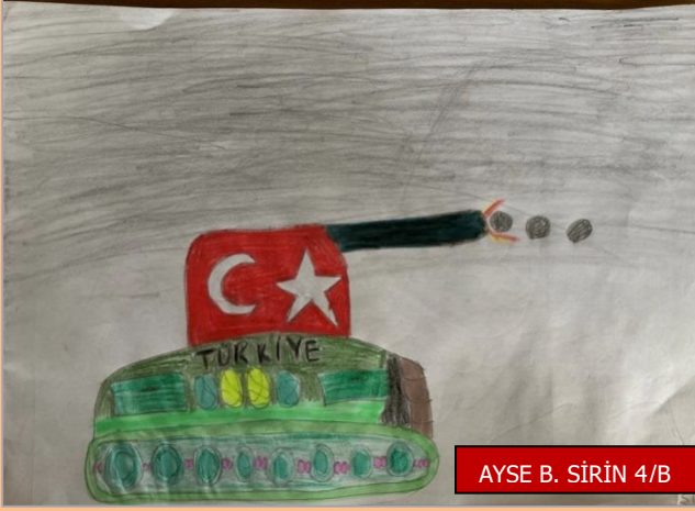
AYSE B. SİRİN 4/B