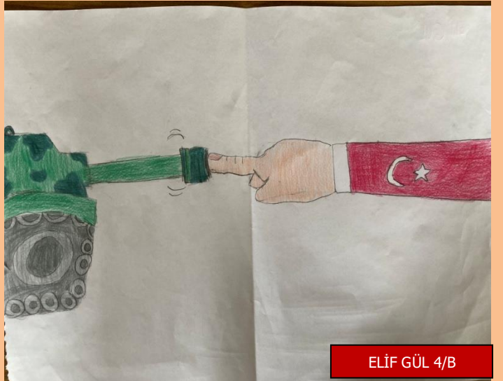
ELİF GÜL 4/B