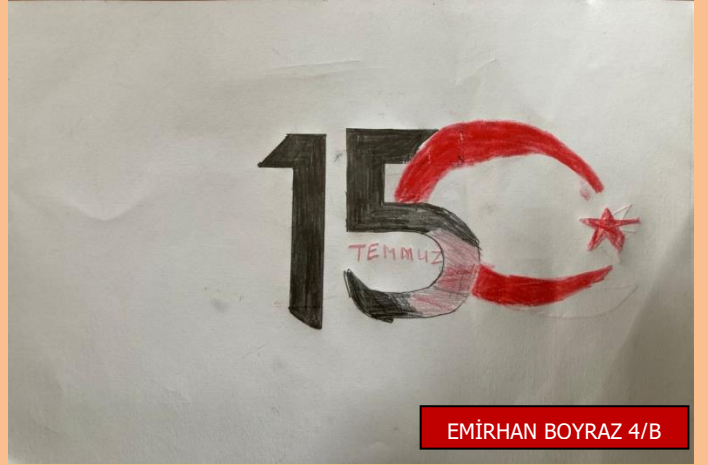
EMİRHAN BOYRAZ 4/B